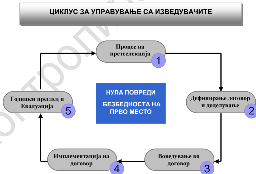
Слика 1. Процес - циклус за управување со изведувачите

Процесот на управување со изведувачите е однапред дефиниран циклус кој се реализира преку постапки прикажани во слика 1.: